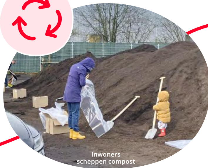
Inwoners scheppen compost