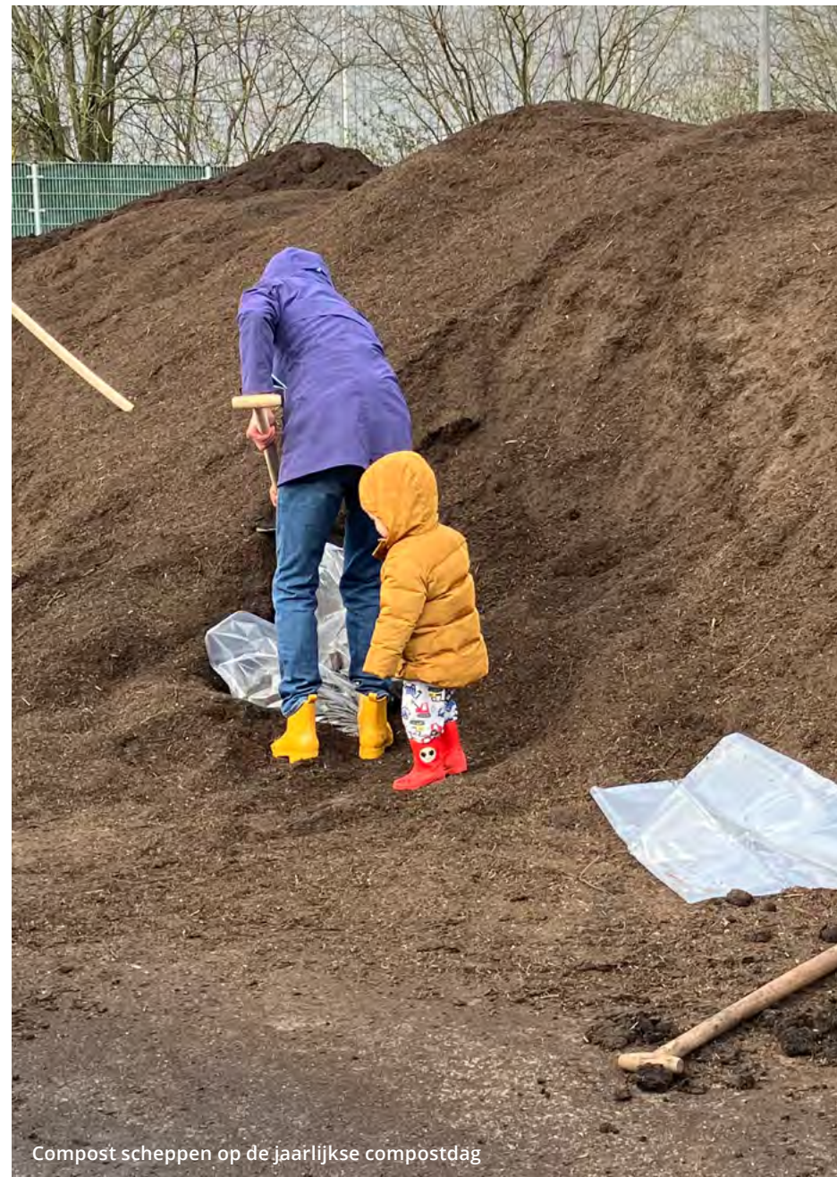
Compost scheppen op de jaarlijkse compostdag

Door omwonendenoverleg, kijkdagen en compostdagen proberen wij een goede en betrouwbare 'buur' te zijn voor onze omgeving. HVC heeft net als vorig jaar een kijkdag georganiseerd samen met Afvalzorg om inwoners te laten zien wat er op de locatie gebeurt. De jaarlijkse compostdag in maart is succesvol verlopen. We hebben aan onze inwoners en tuinverenigingen, tezamen met onze aangesloten gemeenten, ca. 61% meer compost kunnen uitreiken dan het jaar ervoor (2023: 5,7 kton versus 2022 3,5 kton).