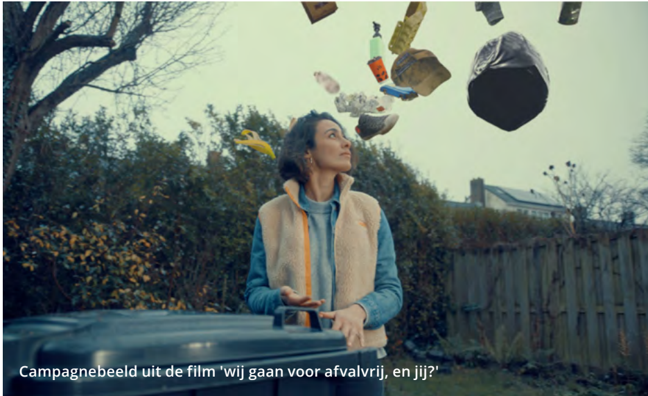
Campagnebeeld uit de film 'wij gaan voor afvalvrij, en jij?'

regie van Rijkswaterstaat en heeft geholpen bij de ontwikkeling van de Menukaart Afvalpreventie. Deze praktische handleiding bestaat uit vijf laagdrempelige iconprojecten die gemeenten direct kunnen invoeren om afvalpreventie te stimuleren. Thema's zijn voedselverspilling, wasbare luiers, delen en lenen, de ja-ja sticker en reparatie. Via presentaties in het voorjaar en een praktisch webinar voor beleidsambtenaren en bestuurders in juni is een eerste stap gezet om deze projecten actief te promoten. Daarnaast zijn er presentaties geweest in diverse HVC-gemeenten over afvalpreventie.