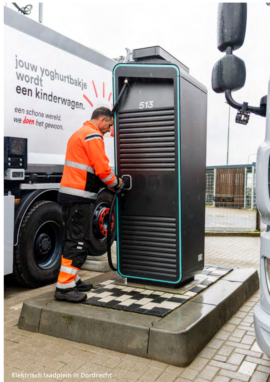
Elektrisch laadplein in Dordrecht

Het wagenpark is in 2023 verder verduurzaamd. Hierbij is wel sprake van grote vertragingen in de levering van voertuigen en apparatuur. Veel voertuigen zijn later geleverd of worden nog verwacht. Daardoor staat eind 2023 het aantal e-voertuigen op 28.